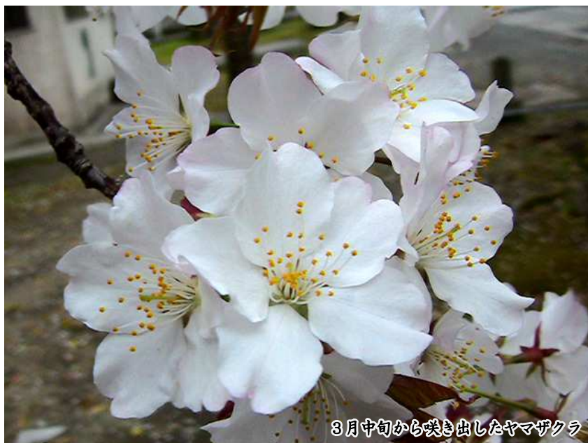
3月中旬から咲き出したヤマザクラ