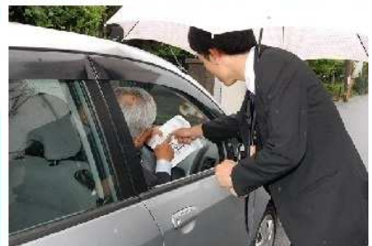
甘木親教会はじめ、各方面から参拝者が到着される祭典前の受付周辺

ご祭典前日から、関係教会、隣接教会の先生方がお手伝いに来られてお供え物などの御用に当たられ、加治木教会信奉者は、「お届・受付部」「広前・参拝部」「接伴部」「調理部」などに分かれて御用を分担し、準備が進められました。