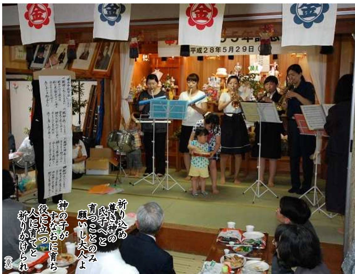
バンド隊は「さんぽ」「小さな世界」「甘木布教讃歌」を演奏させていただきました。

加治木教会 教師・信奉者一同で、先生方はじめご参拝の皆さんをお見送りさせていただきました。