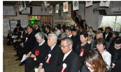
ご参拝の先生方、 親類・信者の皆さん