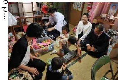
ご祭典前になると子どもたちは奥の方に集合