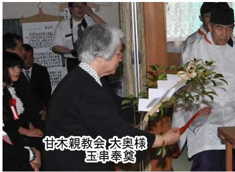
甘木親教会 大奥様 玉串奉奠