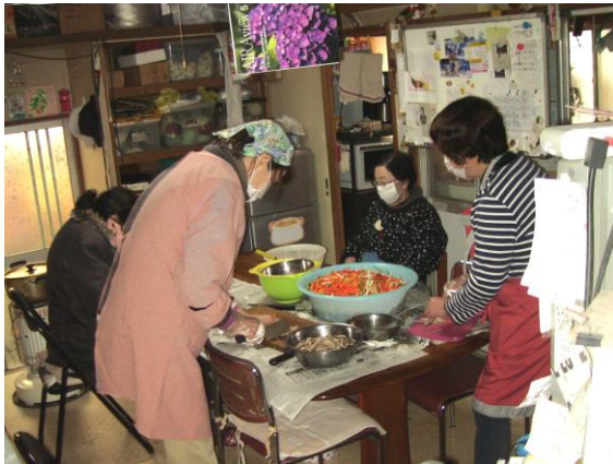
お直会の準備が 進められました(2月9日)