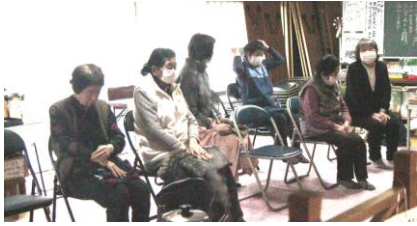
御用初めの御祈念(2月9日)