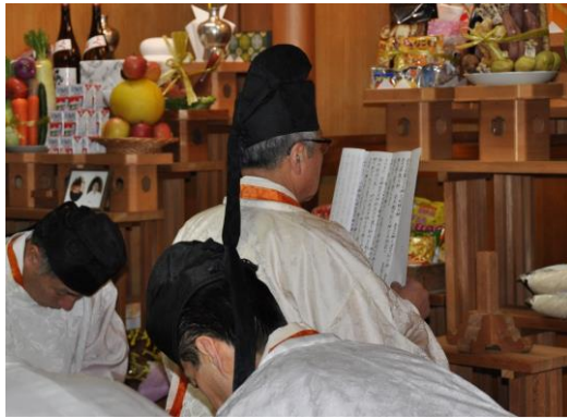
ご神前で親先生ご祭主にて 報徳祭詞・式年祭奏上祭詞 をご奏上される