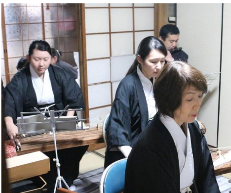
典楽の音色でご祭典が いっそう美しく仕えられました