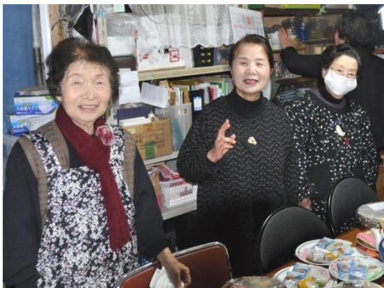
和気あいあいと準備が進められました(2月10日ご祭典前)