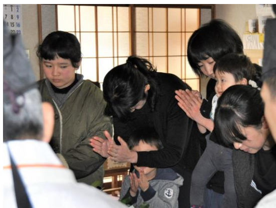
少年少女会 玉串奉奠