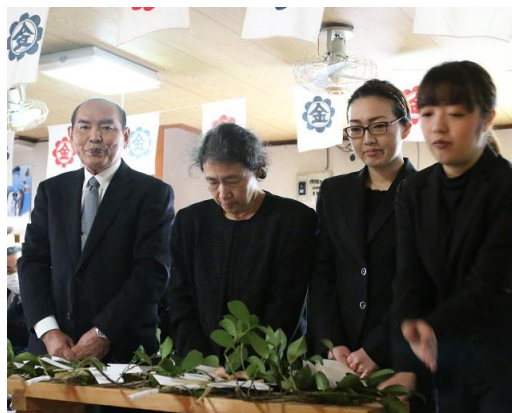
家族親族 玉串奉奠