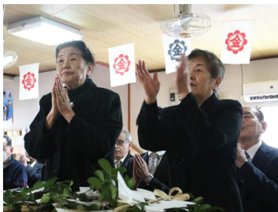
執行委員 玉串奉奠