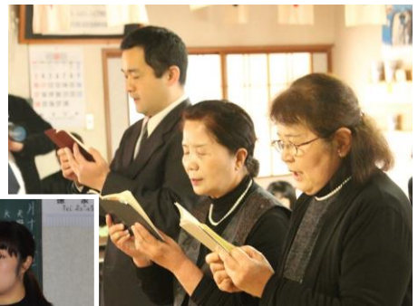
祭典前御祈念が仕えられ いよいよご祭典の開始