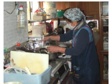
ガネ(かき揚げ)の野菜切り煮物の味付けが進められました(2月9日)