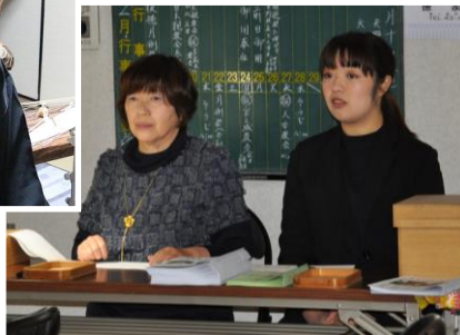
今回の受付の御用は ニューフェイスでした