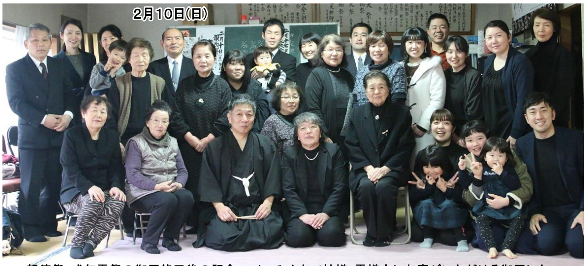
報徳祭・式年霊祭の御用終了後の記念フォト、みんなで神様・霊様方にお喜びいただける御用におおかげを蒙らせていただきました。