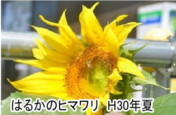
はるかのヒマワリ H30年夏