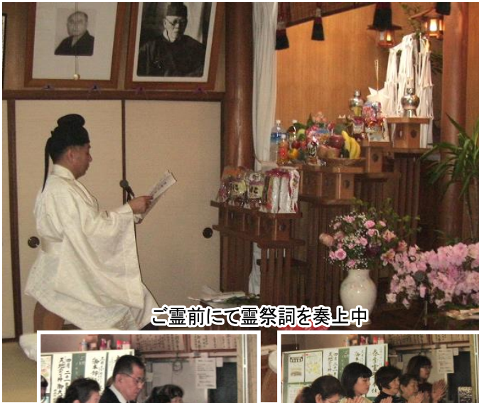
ご霊前にて靈祭詞を奏上中