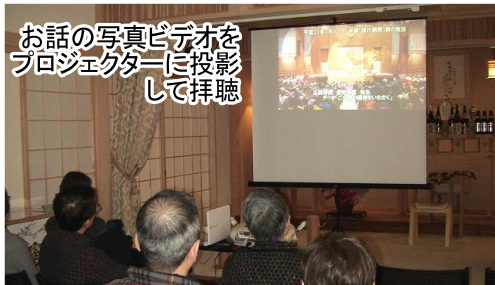
お話の写真ビデオをプロジェクターに投影して拝聴