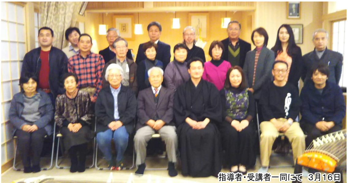
指導者・受講者一同にて 3月16日 於：鹿児島教会

加治木教会でも、九年目にしてようやく龍笛が、御大祭の典楽に加わることができるようになりました。