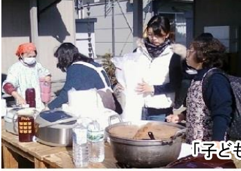
「子ども食堂」へつなげる活動 H30年12月24日