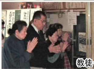
教徒・信徒全員 順次玉串を奉奠