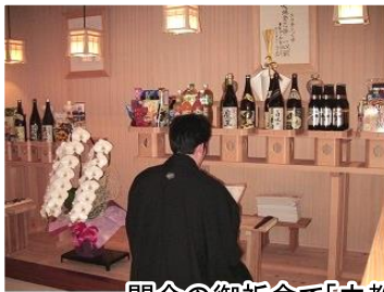
閉会の御祈念で「立教160年御礼祈願詞」を奉唱