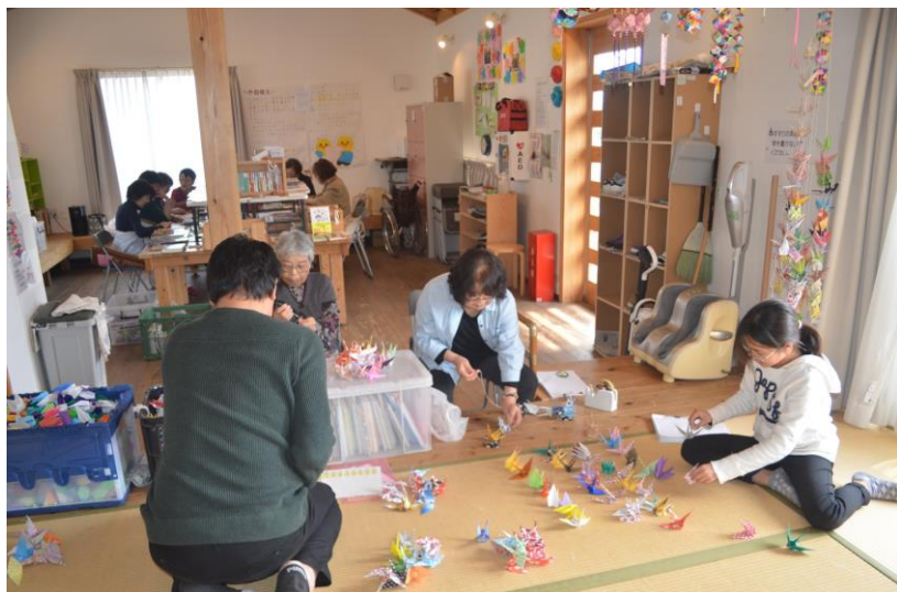
木山仮設団地 集会所にて 3月29日