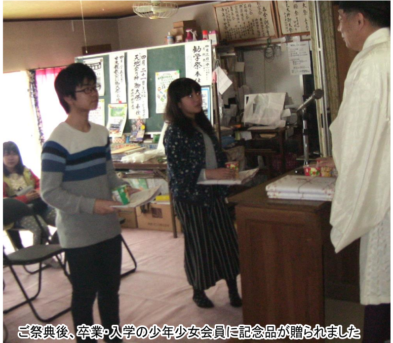
ご祭典後、卒業・入学の少年少女会員に記念品が贈られました