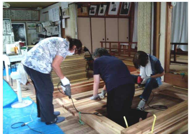
ビスが通りやすくするため根太材にドリルで穴あけ

人吉教会の「令和二年七月豪雨」の復興支援活動での、大工仕事のお手伝いをさせていただいて、作業内容を種々勉強させていただきましたので、その勉強した内容を忘れないように、加治木教会のお広前の古い畳を取り外して、床板を張り、タイルカーペットを敷きました。 二十三畳の広前の、十八畳分をタイルカーペットに、五畳分をフローリングにする予定で、今回は十八畳分をタイルカーペットにしました。