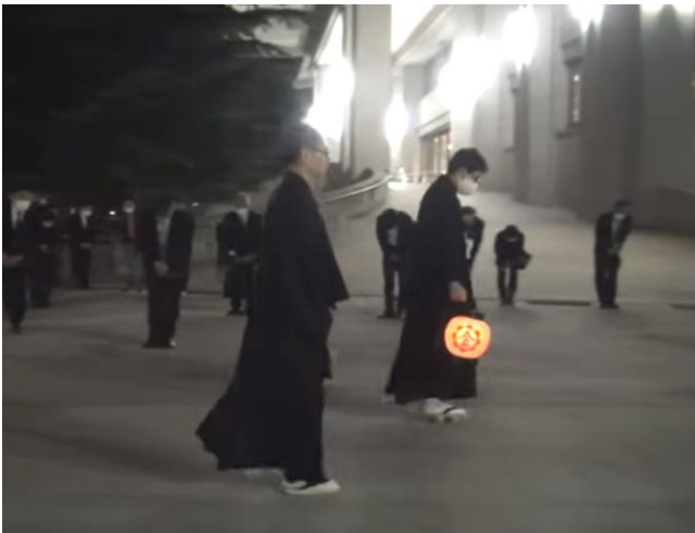
お出まされる教主金光様 10月3日午前3時40分過ぎ

神様と縦軸で結ばれ、神様と仲良くなる生き方を進めてまいります。 (「教務総長挨拶」より) 加治木教会で、改まりの目標として います「親神様の御立場に立った 信心」の内容をお話しされているよ うにも感じられました。 真実に、真剣に、素直に信心を進 めて、そのような信心に到達させ ていただきたいものです。