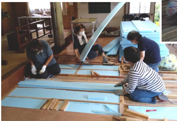
断熱材の発砲スチロールを切って根太の間に

工程期間は六日間(十月十一日～十六日)で、加治木教会の信者の皆さんが代わる代わるお手伝いに来られました。