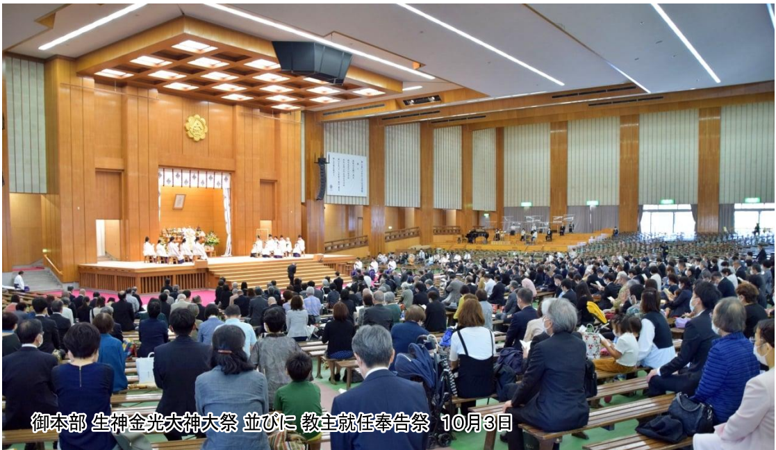
御本部 生神金光大神大祭 並びに 教主就任奉告祭 10月3日

教祖様138年 教団独立121年 小倉教会布教136年 甘木親教会布教117年 安武松太郎大人70年 加治木教会布教70年…5月30日ご祭典が奉仕されました。