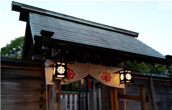
教祖様奥津城 10月2日夕

神様と縦軸で結ばれ、神様と仲良くなる生き方を進めてまいります。 (「教務総長挨拶」より) 加治木教会で、改まりの目標として います「親神様の御立場に立った 信心」の内容をお話しされているよ うにも感じられました。 真実に、真剣に、素直に信心を進 めて、そのような信心に到達させ ていただきたいものです。