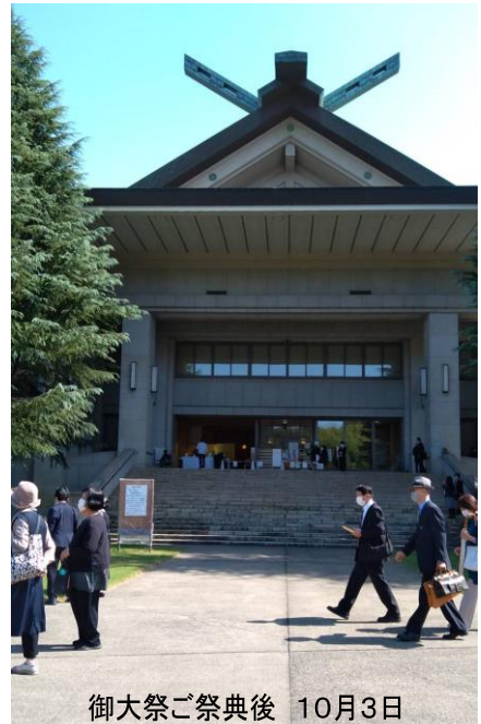
御大祭ご祭典後 10月3日