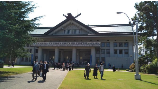
御大祭ご祭典後 10月3日