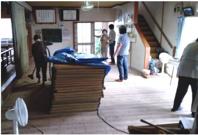
長年使わせていただいた畳…

十月十一日(月)から十六日(土)にかけて、お広前の床の張り替え工事が行われました。 以前から、加治木教会広前の畳が傷みが著しかったので、床を張り替えて、タイルカーペットとなりました。