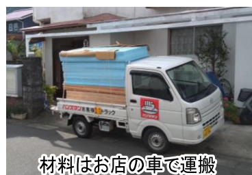
材料はお店の車で運搬