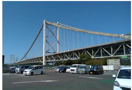
めかりSA(関門大橋を望む) 10月2日正午頃