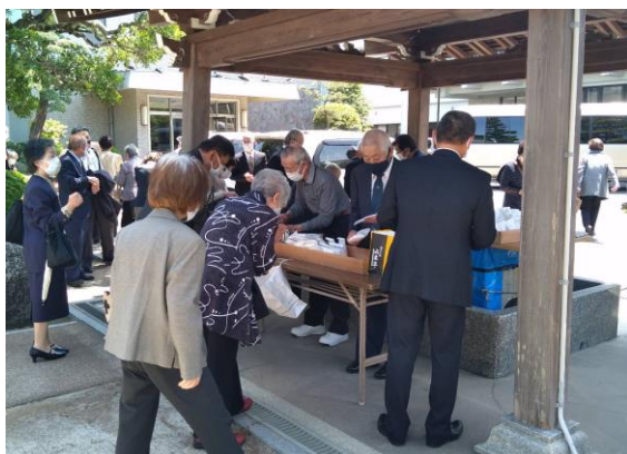
ご教話終了後、境内でお神酒と小餅のお直会が配られました。

人間も同様に鍛われないと育ちません。「かわいい子供には旅をさせよ」という諺もあります。これは、信心させていただく者にとって、大事なところだと思わせていただきます。