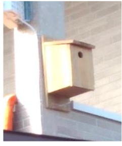
↑ ベランダに取り付けられた巣箱

そのため、ぶつ切りにしたチキンを購入して、準備しました。しかし、その方がたくさん量になり、参加者一同がお昼ごはんのおかずとして、なんとか足りたようなことでした。丸ごとチキンだと、骨も多いダッチオーブンの隙間も多くなり、返って入手できなくて好都合でした。美味しいローストチキンでのお昼ご飯となりました。