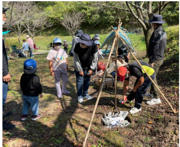
日頃IH(アイエイチ)を使っているので着火になれていないようでしたね!

小鳥の鳴き声も聞こえる「仙寿の里温泉」の森の中の少年少女会は、開会儀礼の中で「この森にはたくさん自然の恵みがあるからこそ、この付近には小鳥のほかに、イノシシやサルやシカなどもいて、天地の豊かなお恵みがあることに感謝をしながら一日をすごさせていただけますよ・・・」というお話がありました。