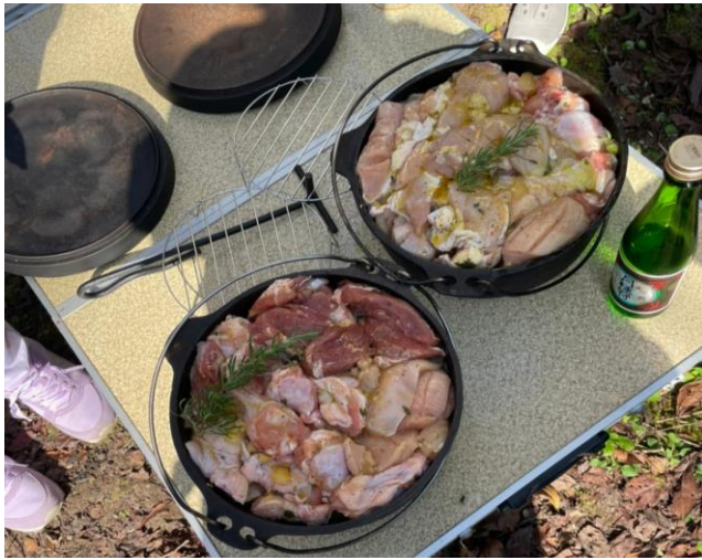
野菜の上に、鶏肉をつめこんで！

そのため、ぶつ切りにしたチキンを購入して、準備しました。しかし、その方がたくさん量になり、参加者一同がお昼ごはんのおかずとして、なんとか足りたようなことでした。丸ごとチキンだと、骨も多いダッチオーブンの隙間も多くなり、返って入手できなくて好都合でした。美味しいローストチキンでのお昼ご飯となりました。