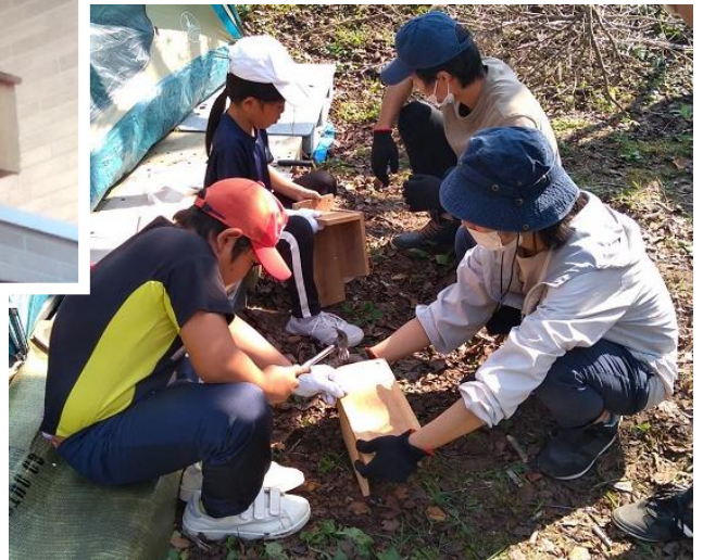
なれない大工さんのような作業でしたね！

また、この日の早朝に急いで味付けして下ごしらえをしていたので、一部に塩が付きすぎ、塩辛い鶏肉に当たった人もあるというハプニングもありました。ダッチオーブンで、鶏肉や野菜に火が通る間に「鳥の巣箱作り」をしました。