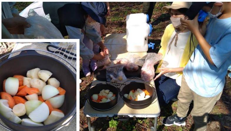
ダッチオーブンに野菜をしきつめて・・・

調理用鉄鍋二個で作る予定でしたが、付近のスーパ―に食べやすい若鳥の丸ごとチキンがありませんでした。(親鶏の丸ごとチキンはあるのですが肉が堅かったので使えませんでした。)