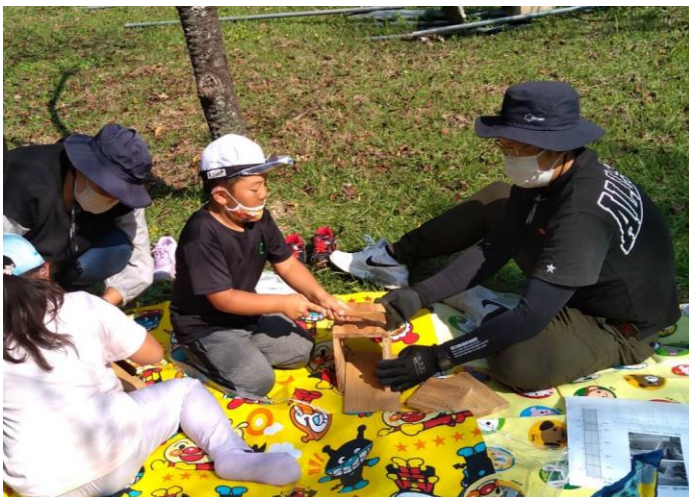
お父さんにガンパってもらいました！

また、この日の早朝に急いで味付けして下ごしらえをしていたので、一部に塩が付きすぎ、塩辛い鶏肉に当たった人もあるというハプニングもありました。ダッチオーブンで、鶏肉や野菜に火が通る間に「鳥の巣箱作り」をしました。