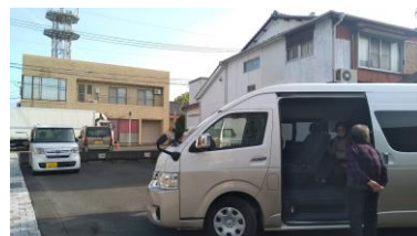
今回10人乗りのワゴン車で参拝 3/30 AM8:30