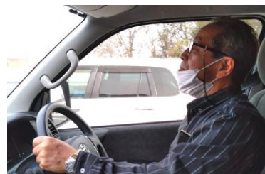
時間に余裕をもって安全運転で...