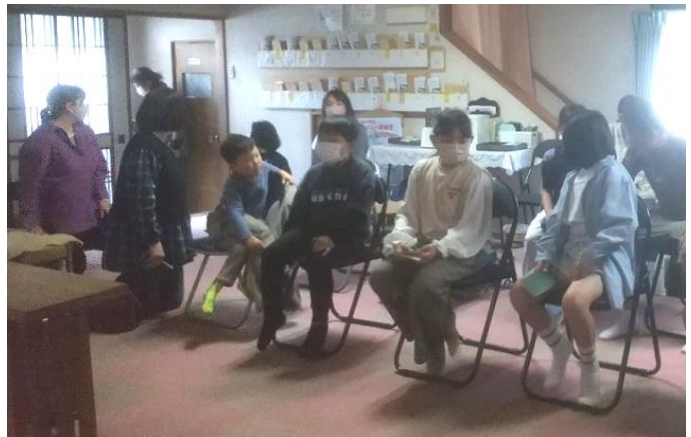
少年少女会員のみんなが勸学祭に参拝し玉串奉奠をさせていただきました