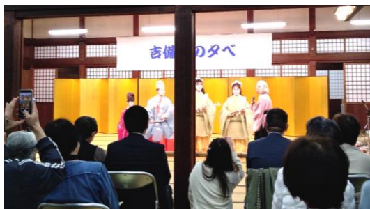
前夜、修徳殿にて 吉備舞の夕べが開かれていました 3/30