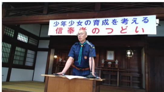
ご祭典終了後、修徳殿で 信奉者の集いが開かれました 3/31