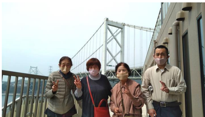
鹿児島県から熊本県のSAでは桜が満開でした 3/30