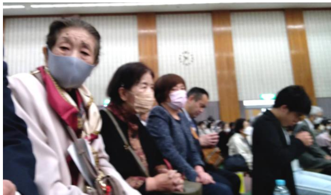
皆でご祭典を拝ませてくださいました 3/31