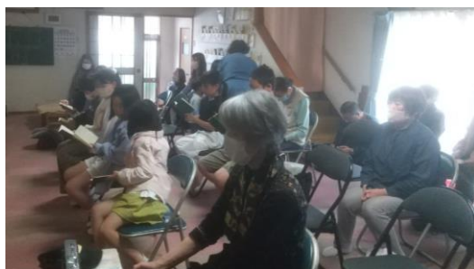
少年少女会員の小学校新入学者には記念品が 参拝できたみんなにはお直会が配られました