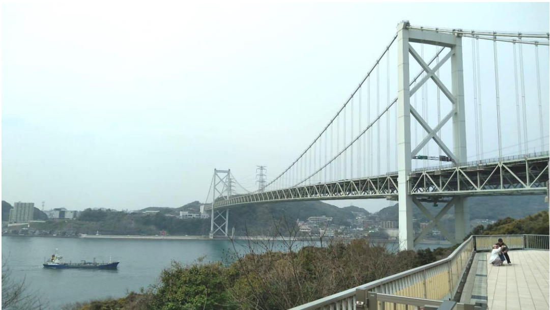
御本部 天地金乃神御大祭参拝 往路(めかりPAにて 3/30)

立教165年／小倉教会布教139年／甘本親教会布教120年／加治木教会布教73年