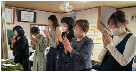
若婦人会 玉串奉奠