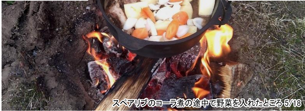
スペアリブのヨーラ煮の途中で野菜を入れたところ 5/18