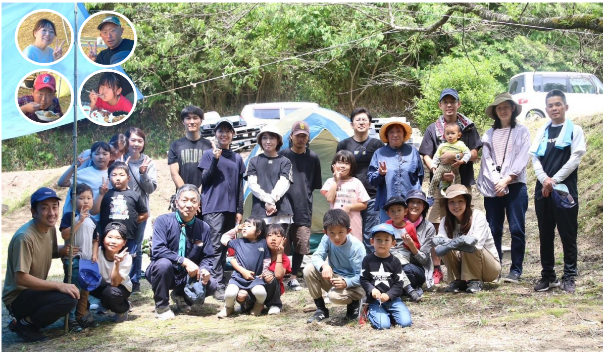
森の中の記念写真

最初、スペアリブをダッチオーブンに入れて、コーラと醤油で味付けをし、三つのダッチオーブンは、それぞれローズマリー・シヨウガ・ニンニクで三種類の香りづけをしました。