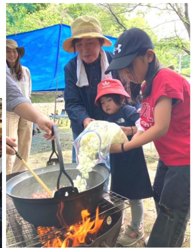
たくさんの野菜の入れて…