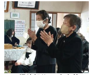
信徒総代 玉串奉奠