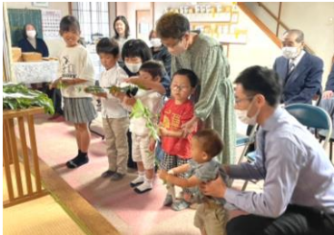
少年少女会 玉串奉奠