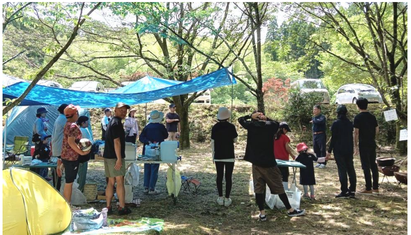
少年少女会は、開会儀礼・お教えに始まります。