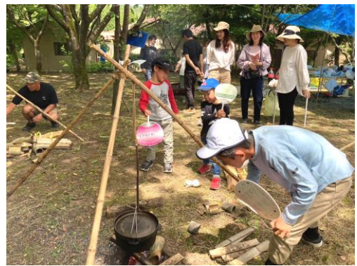
スペアリブは、まず中火で20分、・・・そして、野菜を投入して30分煮込みます！