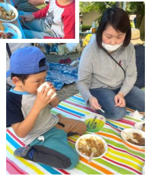
焼きマシュマロも 楽しそうでした！

スペアリブの肉だけ二十分ほど煮込んで、その後、ジャガイモやタマネギ・ニンジンなどを投入して、さらに三十分煮込んでできあがりです。予想以上に美味しいできあがりとなりました。 カレーは、現場で野菜を切つてもよいのですが、毎回幼児も参加しますので、刃物を使つての細かい作業