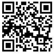
教会ブログ『あしあと』