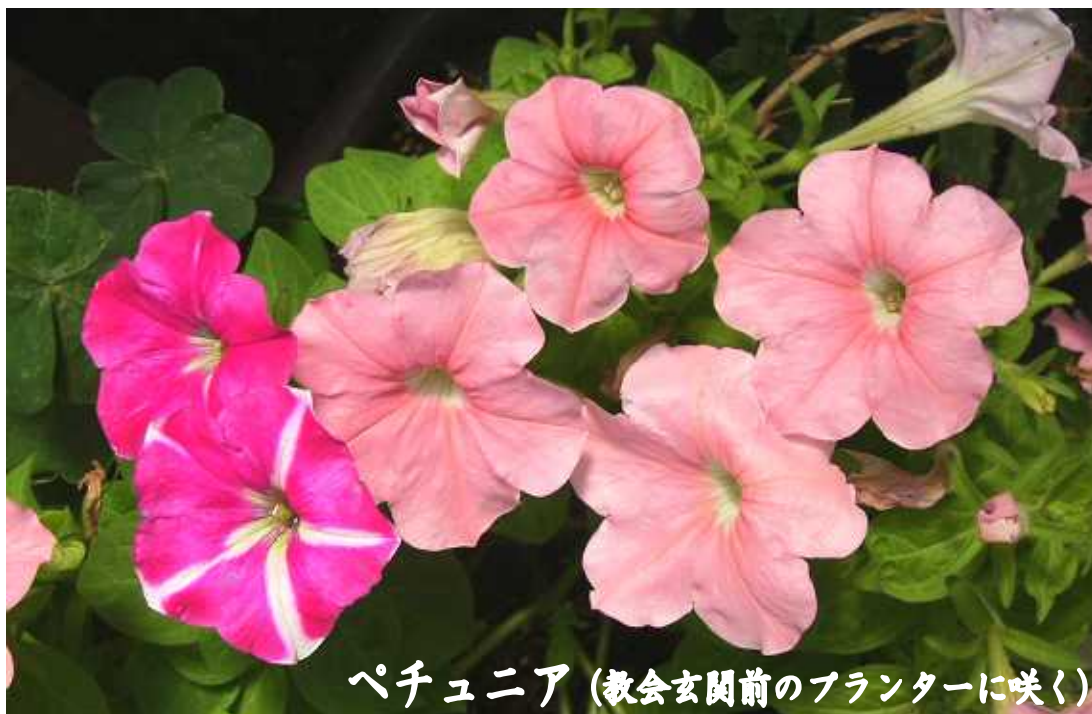
ペチュニア (教会玄関前のプランターに咲く)

発行：金光教加治木教会 〒899-5213 鹿児島県始良市加治木町朝日町130 発行責任者：矢野文枝 TEL 0995-62-2895 Mアドレス konko.m.kajiki@ksj.biglobe.ne.jp ホームページ http://www.7a.biglobe.ne.jp/~konkokajiki