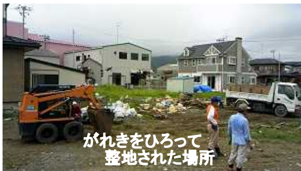
がれきをひろって 整地された場所

金光教少年少女会連合本部「東日本復興支援団」では、これまで五月から七月の間、十回にわたり一回に十日間二十人ほどを限定して支援団員を募集し、御本部からマイクロバスを運行して、募集に応募した派遣団員を乗せて石巻市へ赴き、石巻教