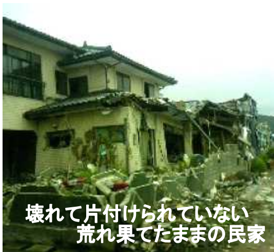
壊れて片付けられていない 荒れ果てたままの民家