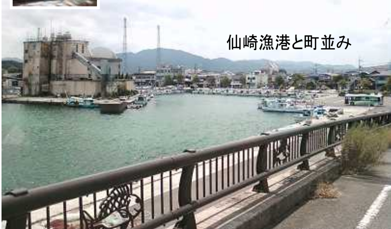
仙崎漁港と町並み

一行は、長門市内の特産品のお店が集まったところで、たつぷりと昼食を頂き、十九時過ぎに無事加治木教会へ到着しました。 神様・霊様に、そして親奥様方に「ありがとうございます」と元氣にお礼申させていただきました。