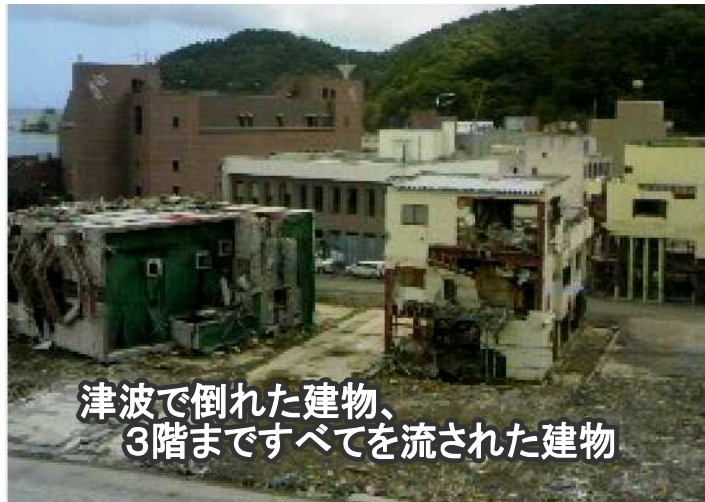
津波で倒れた建物、3階まですべてを流された建物

の集いでの友だちも一緒に参加して、有意義な奉仕作業となつたようです。 この体験が、将来の人生に役立ち、信心の成長につながって行くことが願われます。