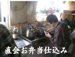
直会お弁当仕込み