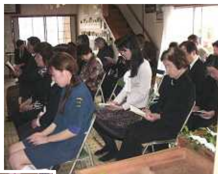
拝詞奉唱中の参拝者