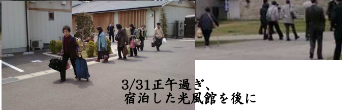
3/31正午過ぎ、 宿泊した光風館を後に