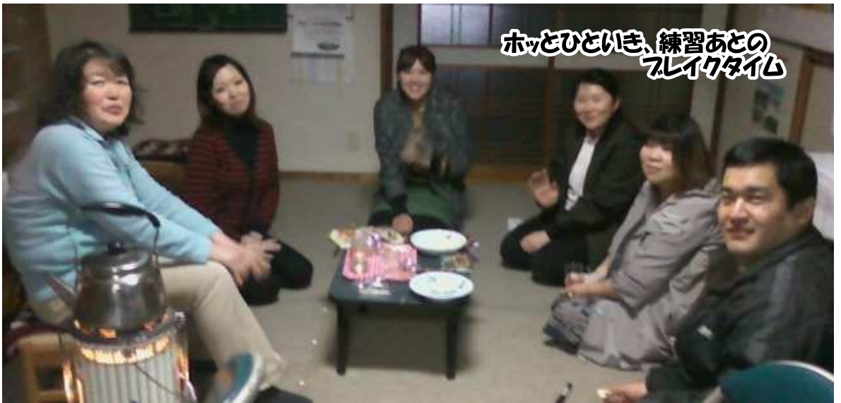
ホッとひといき、練習あとのフレイクタイム