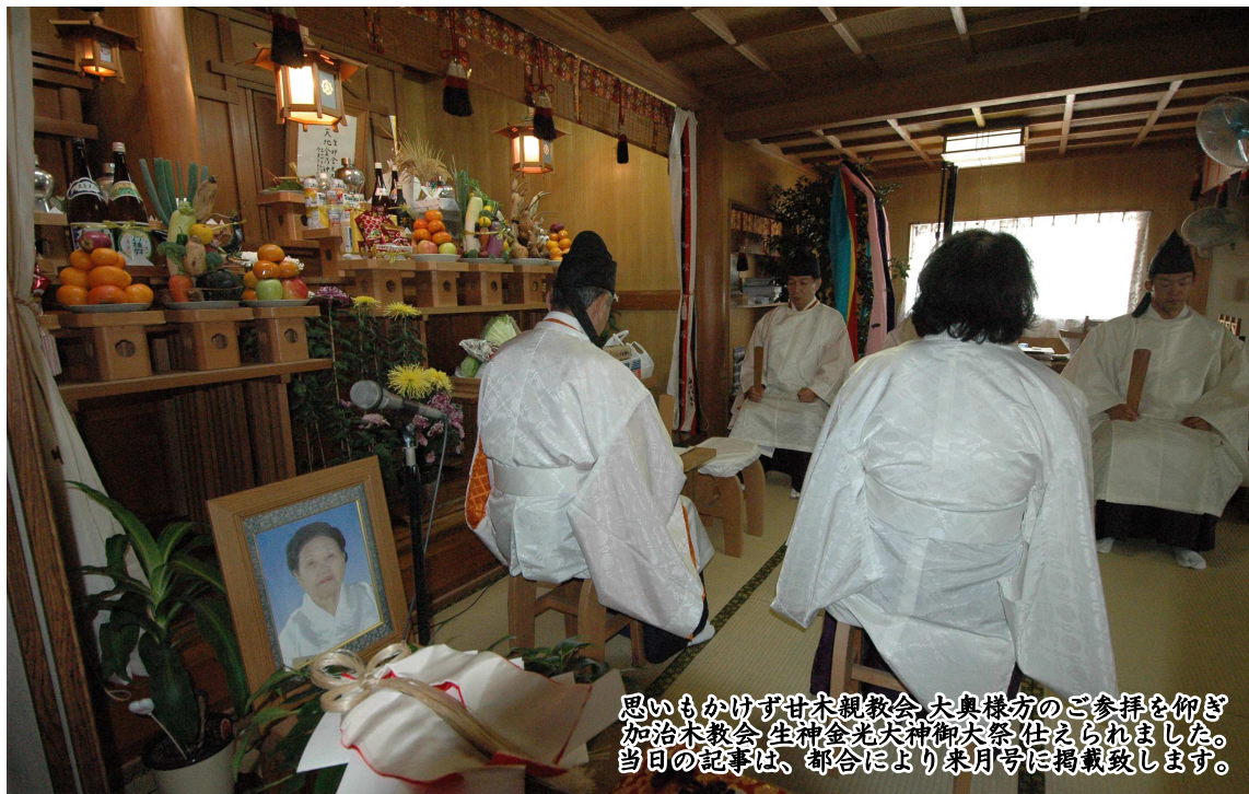
思いもかけず甘木親教会、大奥様方のご参拝を仰ぎ 加治木教会、生神金光大神御大祭仕えられました。 当日の記事は、都合により来月号に掲載致します。