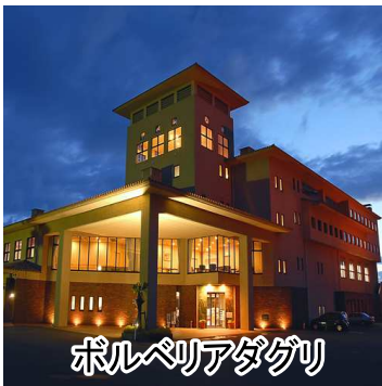
ボルベリアアグリ