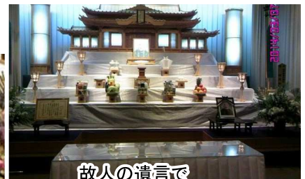
故人の遺言で 「戦場で斃れた戦友等を 思い、祭壇はきわめて 質素に…」と