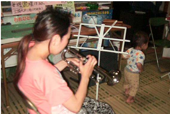
6月6日 しょうま君も応援団