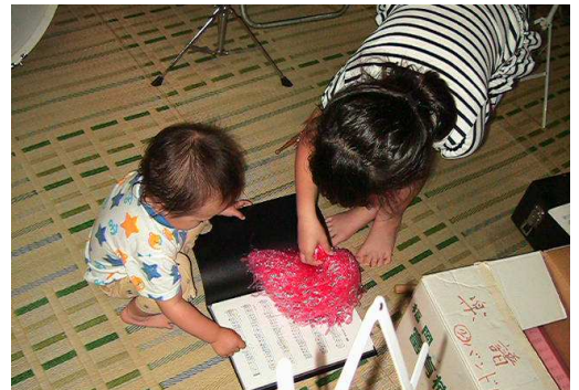
6月6日 しょうま君も楽譜に興味深々