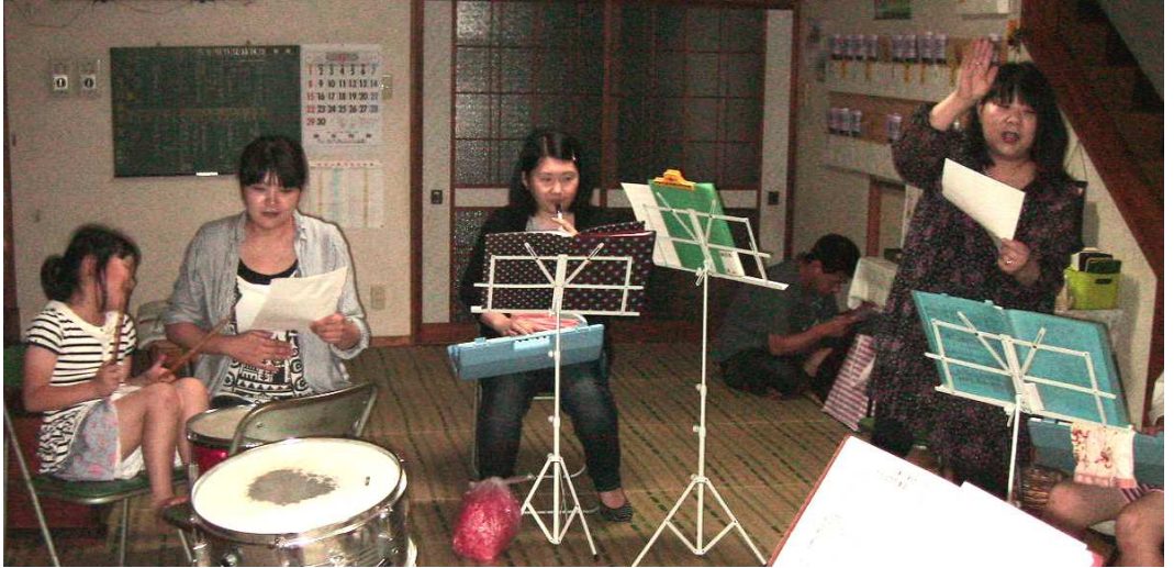
6月6日 この日から「道のわかば」「信心の道を…」も練習開始！