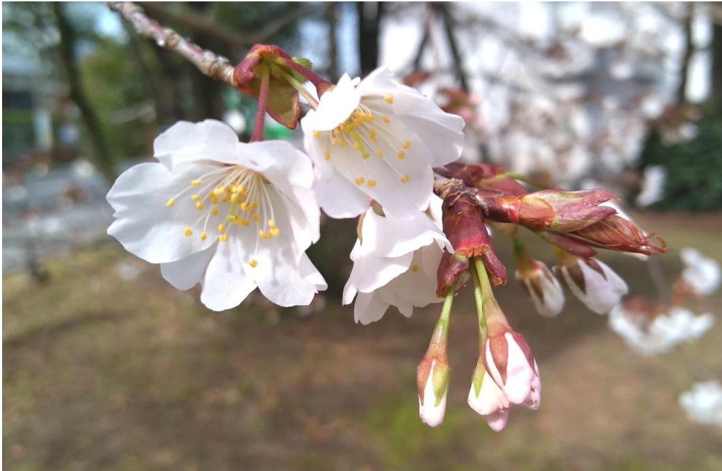
薩摩の国の里山や町中にも、ソメイヨシノより 半月ほど早く咲くヤマザクラ

立教167年／小倉教会布教141年／甘木親教会布教122年／加治木教会布教75年