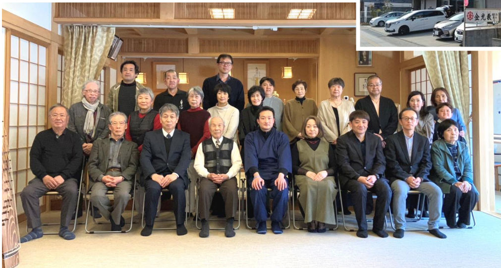
講師・参加者一同で記念撮影